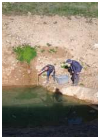
Mesure régulière du niveau de remplissage

Dans le cadre de la protection contre les incendies, la commune comptait un secteur géographique non pourvu de « système de défense incendie ». Afin de remédier à ce manque et pour se mettre en conformité, de lourds travaux avaient été entrepris au cours de l'année 2023 afin de réaliser une réserve d'eau naturelle. En partenariat avec un riverain qui a mis à disposition de la commune une mare, cet équipement a pu être réalisé. Cependant la longue période de sécheresse n'avait pas favorisé son remplissage. Mais la météo du printemps a enfin répondu à nos attentes. La source a également retrouvé son chemin et la réserve commence à se constituer et sera opérationnelle dans quelques semaines.