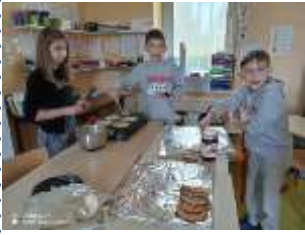
Préparation de la pâte à crêpe par les élèves des deux écoles