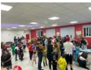
Carnaval organisé par le Sou des Ecoles et l'APEL

MJC et du CAV ; de magnifiques décorations réalisées par des mamans de l'école ; des vêtements de seconde main pour les derniers cadeaux