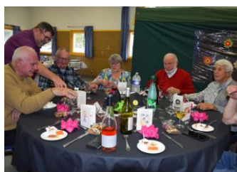
Une infime partie des convives !