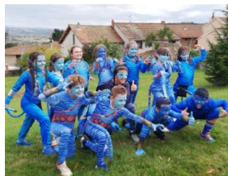
Les dix ans...

où est donc passée la 7 ème compagnie » pour les 50 ans. A l'issue du défilé dans les rues de Villemontais, la journée s'est poursuivie autour d'un vin d'honneur offert par les classes en 3 et du traditionnel repas dansant.