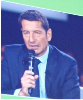
David Lisnard, Président des maires de France

Dernière grande rencontre de l'année : le Congrès des Maires de France à Paris. Plus de 11 000 élus locaux ont investi le Parc des expositions de Paris du 20 au 24 novembre 2023. Parmi eux, la délégation des maires ligériens était fortement représentée. « Communes attaquées, République menacée » tel était le sujet central du Congrès. Si de nombreuses interventions tournaient autour de cette thématique, les sujets d'actualité occupaient très largement les débats : la transition énergétique avec toutes les injonctions faites aux communes pour réduire de 40% leur consommation énergétique ; la réduction des terrains constructibles avec l'application de la loi ZAN ( zéro artificialisation nette ) ce qui nous contraint à réduire de 50%