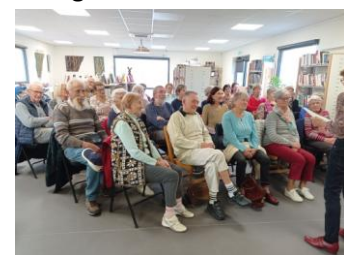
Une assistance nombreuse et très attentive ! Un goûter très convivial a clôturé l'après-midi.