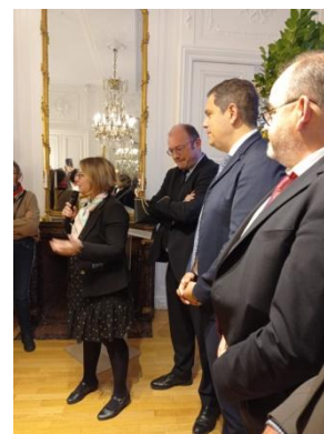
Nos 4 Sénateurs nous ont accueillis pour le petit-déjeuner à l'hôtel de la Questure

Le rendez-vous 2024 est donné en Bourgogne.