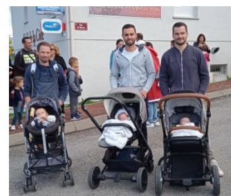
Les papas, les bébés 2023