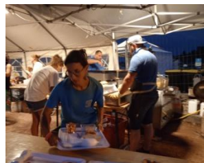
L'équipe aux fourneaux !