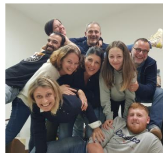
une partie des acteurs...