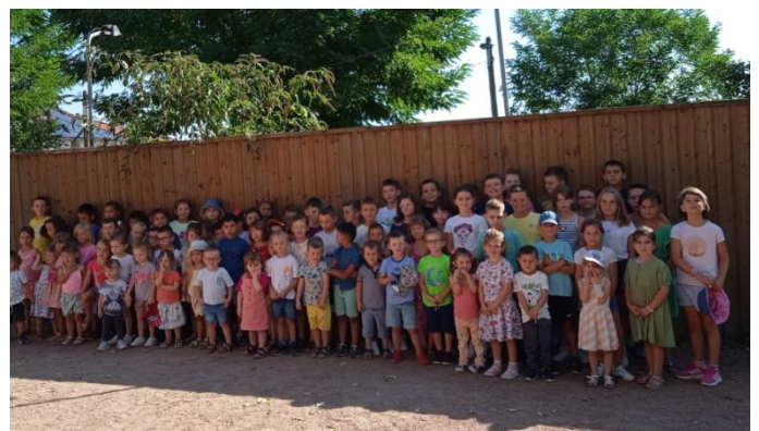
Les enfants des 4 classes réunies, de 2 à 11 ans.

Les élèves de toutes les classes préparent activement leur spectacle de Noël qui aura lieu le vendredi 15 décembre à 19h30, à la salle de basket de Ranvier.