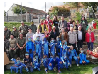
Les 47 classards